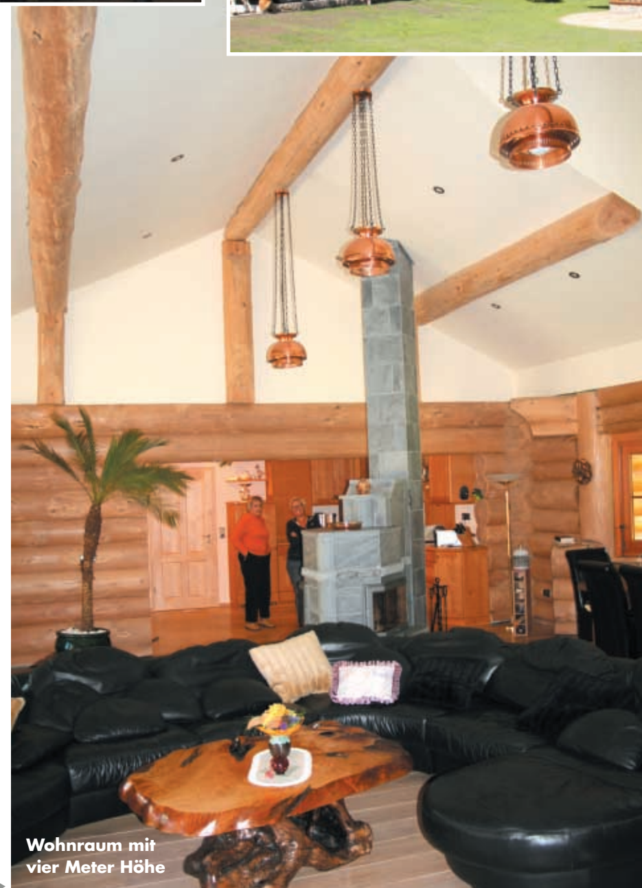
Wohnraum mit vier Meter Höhe

Der Aufbau des riesigen Wohnhauses am erworbenen Grundstück ging ohne ▶