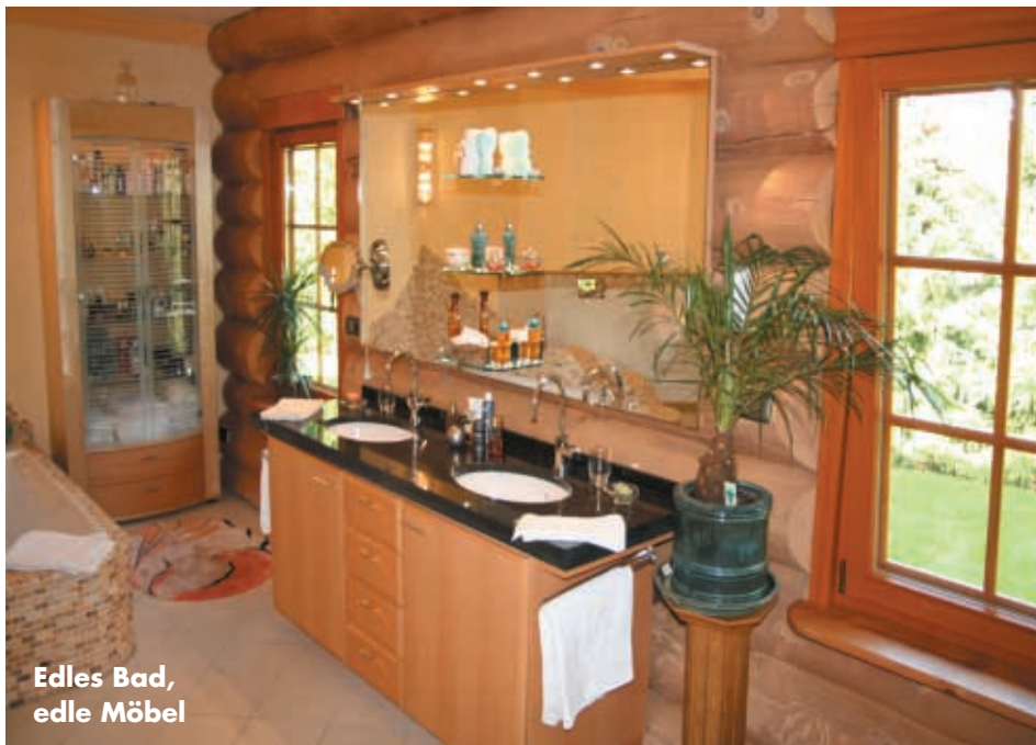
Edles Bad, edle Möbel