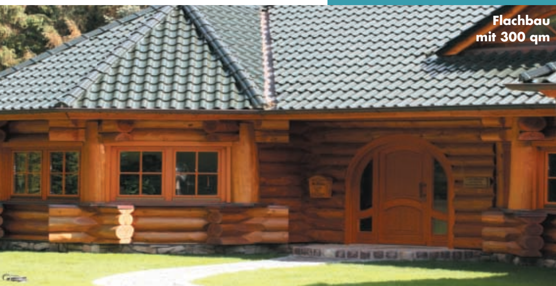
Flachbau mit 300 qm