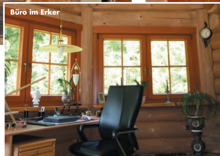
Büro im Erker

Wie aus einem Haus zwei wurden und aus einem 'normalen' ein handgefertigter Naturstamm-Gigant, erzählt die norddeutsche Familie Mull.