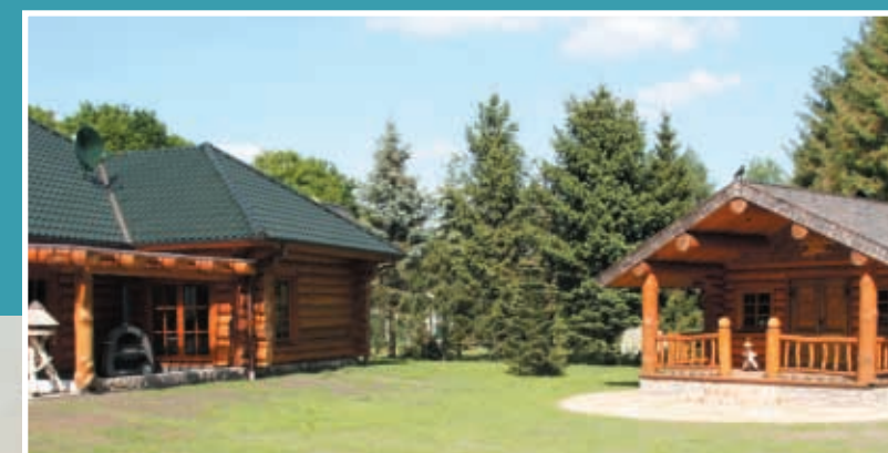
Haupthaus und Freizeithaus