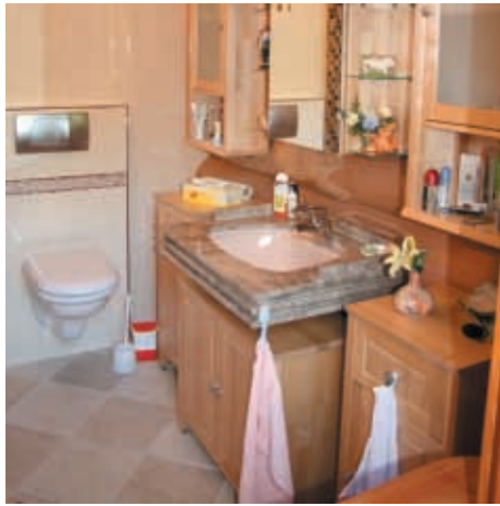
Perfekte Bäder im ganzen Haus