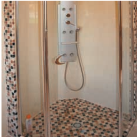
Dusche mit Mosaikfliesen